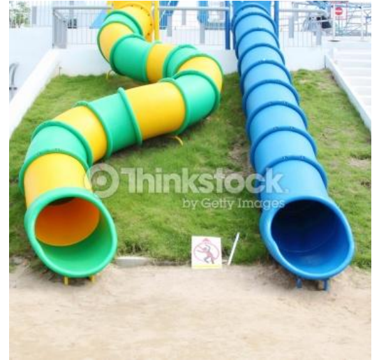
Tubes & tunnels